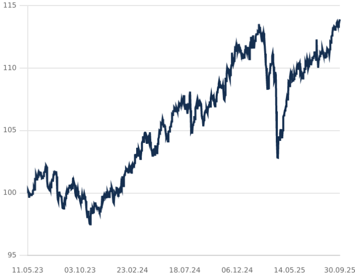
DIP - PARADIGMA STABLE RETURN CLASE C EUR Acc

El rendimiento pasado no es un indicador de rentabilidades futuras