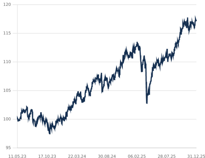
DIP - PARADIGMA STABLE RETURN CLASE C EUR Acc

El rendimiento pasado no es un indicador de rentabilidades futuras