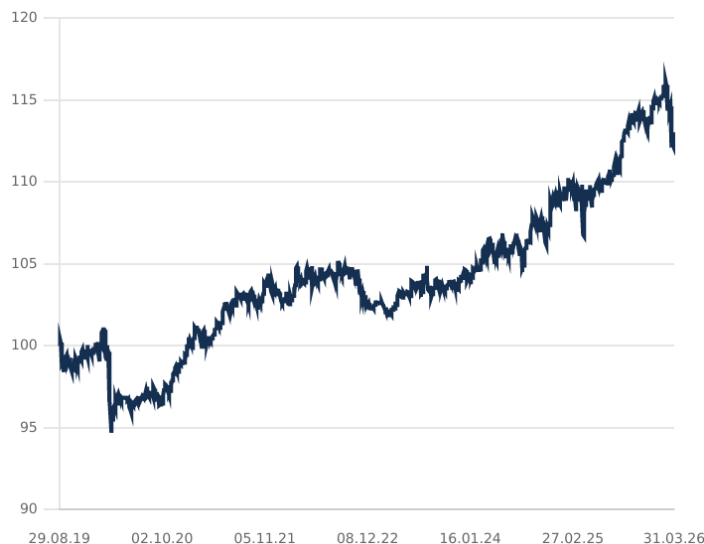
DIP - PARADIGMA CONSERVATIVE MULTI ASSET CLASE C

El rendimiento pasado no es un indicador de rentabilidades futuras