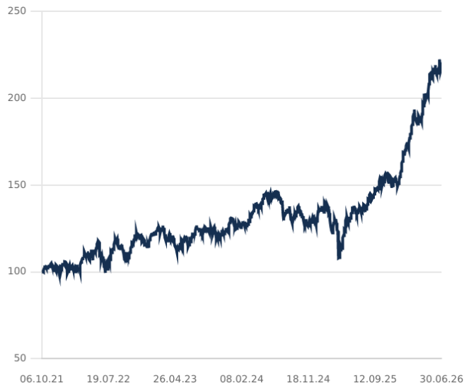
DIP - PARADIGMA VALUE CATALYST EQUITY FUND CLASE C