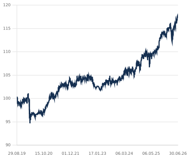
DIP - PARADIGMA CONSERVATIVE MULTI ASSET CLASE C

El rendimiento pasado no es un indicador de rentabilidades futuras