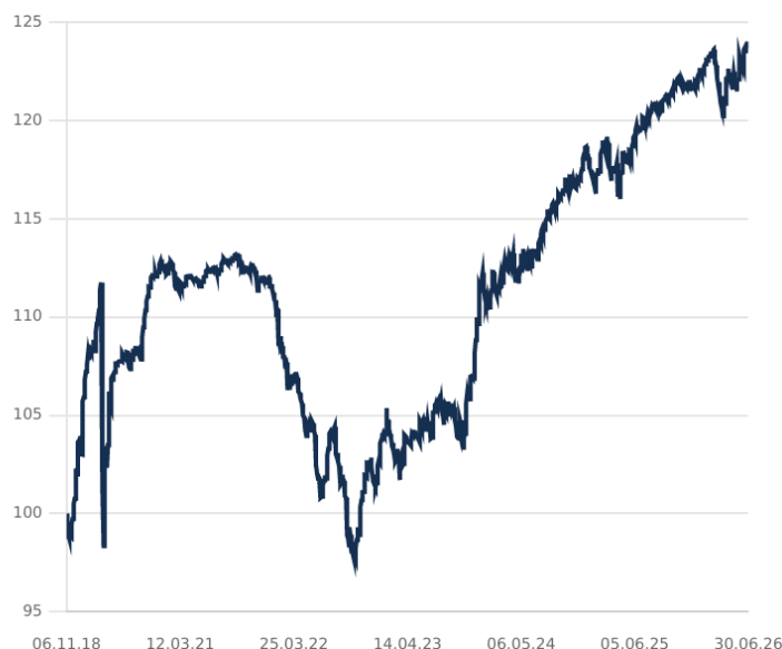
DIP - PARADIGMA HIGH INCOME BOND CLASE C EUR Cap